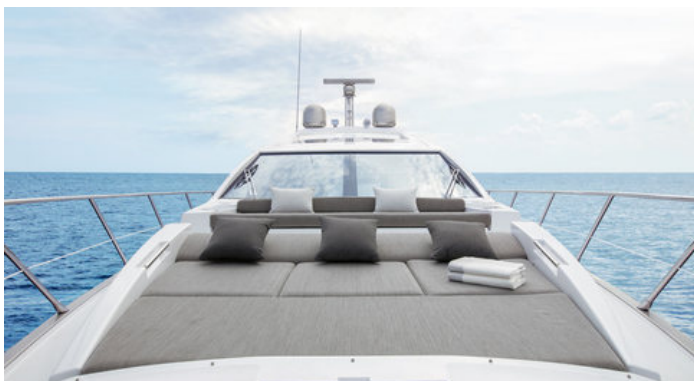
Зона для загорания на носовой части палубы