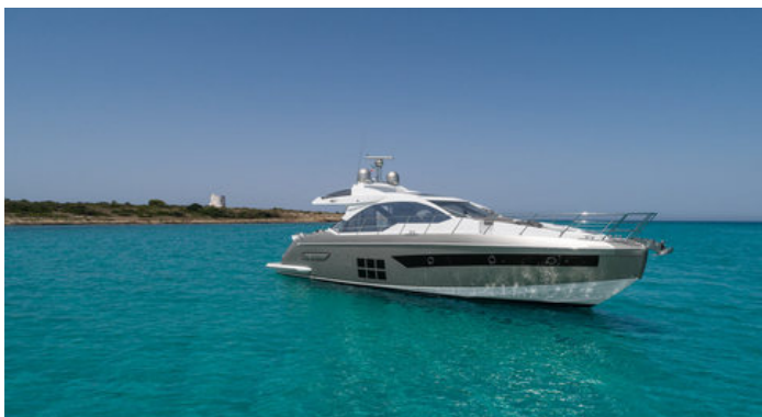
Экстерьер Azimut S6