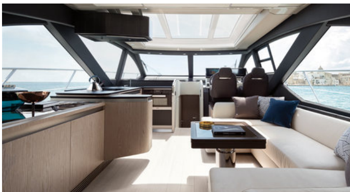
Салон на главной палубе