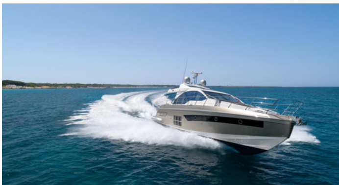
Экстерьер Azimut S6