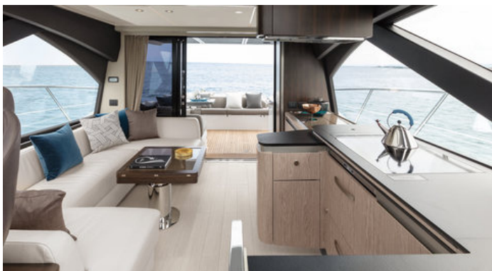
Салон на главной палубе