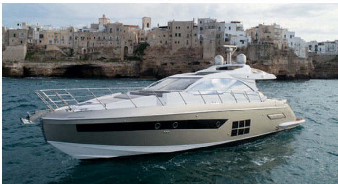
Экстерьер Azimut S6