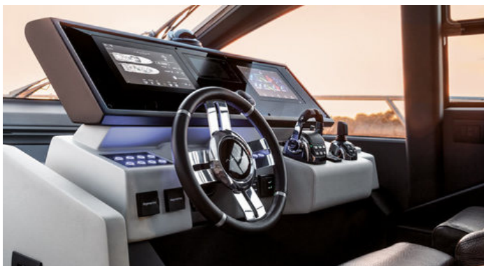
Главный пост управления