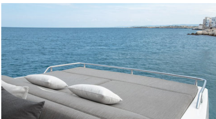
Зона отдыха на кормовой части кокпита